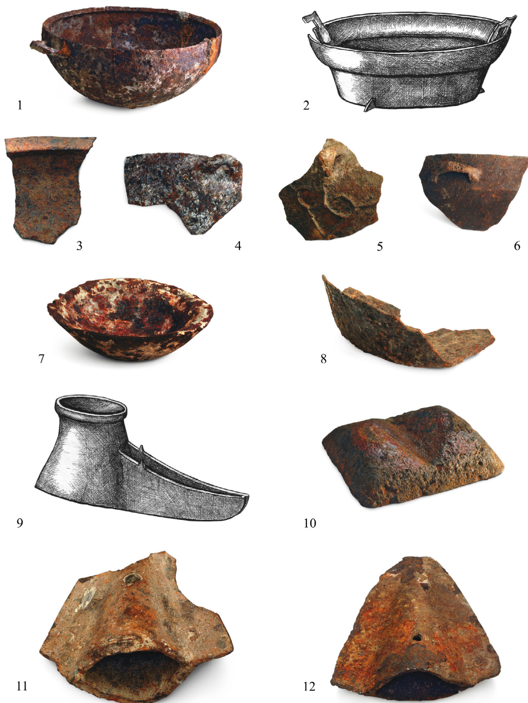
Рис. 1. Чугунные изделия: 1 – котел, Талгар, анализ 1402; 2 – китайский котел, Талгар, анализ 1721; 3–6 – фрагменты котлов, Талгар, анализ 2256, 1401, 1722, 1760; 7 – ступка, Талгар, анализ 2255; 8 – фрагмент жаровни, Талгар, анализ 1761; 9 – светильник, Отрар, анализ 1970; 10 – слиток, Талгар, анализ 2327; 11, 12 – лемехи, Талгар, анализ 1726, 1396

Fig. 1. Cast iron products: 1 – a cauldron, Talgar, analysis 1402; 2 – a Chinese cauldron, Talgar, analysis 1721; 3–6 – cauldron fragments, Talgar, analyses 2256, 1401, 1722, 1760; 7 – a mortar, Talgar, analysis 2255; 8 – a brazier (fragment), Talgar, analysis 1761; 9 – a lamp, Otrar, analysis 1970; 10 – an ingot, Talgar, analysis 2327; 11, 12 – ploughshares, Talgar, analyses 1726, 1396