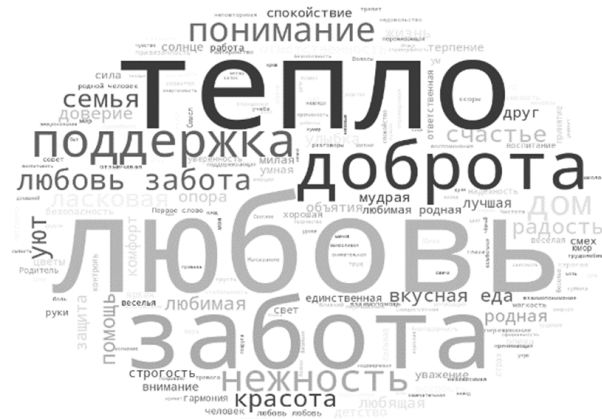
• Забота и поддержка представлена словами-ассоциациями, связанными с действиями и поведением мамы и направленными на помощь (внимание мамы к нуждам ребенка) и обеспечение благополучия. Поддержка мамы может указывать на ее важность в критических моментах в жизни ребенка. • Наставничество содержит ассоциации, связанные с обучением бытовым навыкам, передачей мамой своего опыта.

• Умиротворенность включает слова-ассоциации, описывающие мягкость характера мамы, ее внутреннее спокойствие, атмосферу гармонии. Респонденты называли такие качества мамы, которые обеспечивают внутреннее спокойствие, отсутствие тревоги, согласованность мыслей, чувств и действий.