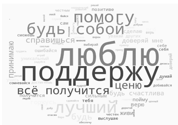
Рис. 3. Облако слов поддержки Fig. 3. Word cloud for verbal associates support words