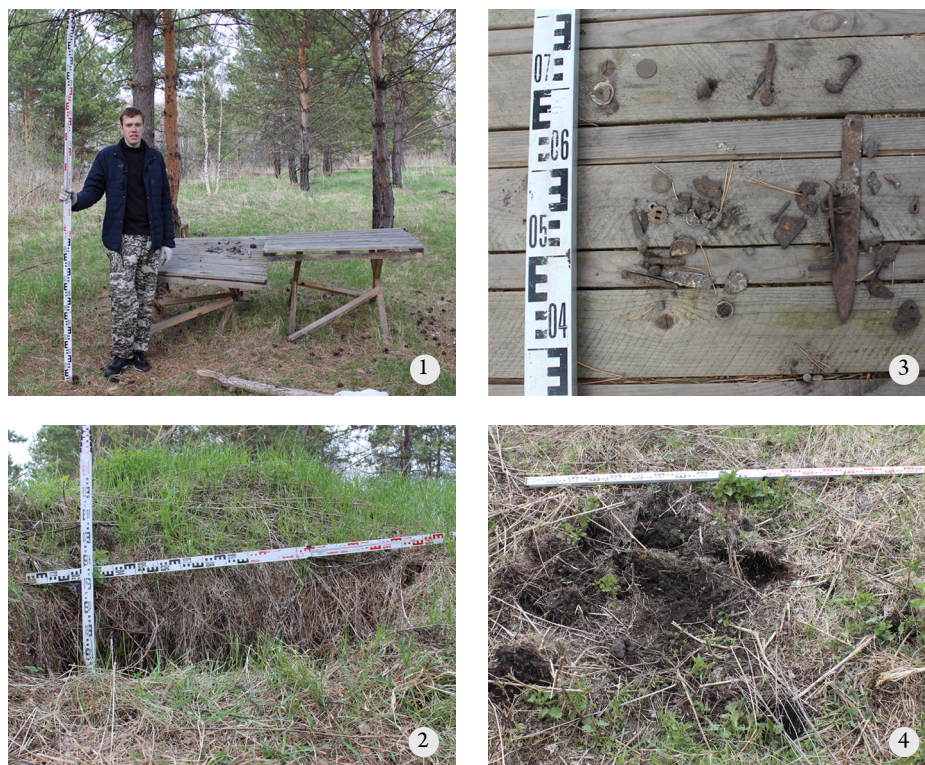
Рис. 2. Следы грабительской деятельности на памятнике Кулаково III в 2018 г. 2.1, 2.3 – остатки бивуака с выброшенными грабителями предметами из культурного слоя поселения; 2.2, 2.4 – грабительские шурфы Fig. 2. Traces of looters' activity at the Kulakovo III site in 2018. 2.1, 2.3 – remains of a bivouac with artifacts disposed by looters; 2.2, 2.4 – looters' test trenches