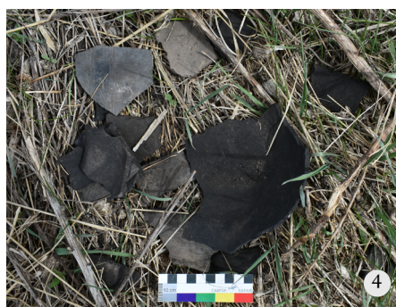
Рис. 3. Следы грабительской деятельности на памятнике Кулаково III в 2019 г. 3.1, 3.2, 3.3 – грабительские шурфы на территории памятника; 3.4 – керамическая посуда из культурного слоя поселения, выброшенная грабителями Fig. 3. Traces of looters' activity at the Kulakovo III site in 2019. 3.1, 3.2, 3.3 – looters' trenches on the territory of the site; 3.4 – pottery from the cultural layer of the settlement disposed by looters